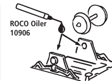
ROCO Oiler 10906

Les pièces de finition illustrées sont à monter par le modéliste. Le jeu de pièces peut comprendre d'autres pièces (non illustrées) qui sont destinées à autres versions du modèle et qui sont superflu à la variante présente.